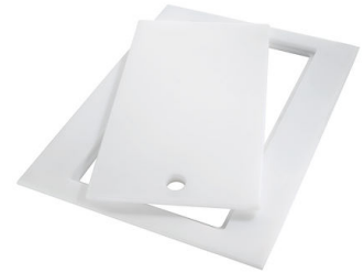
PLANCHE DE DECOUPE DOUBLE HDPE